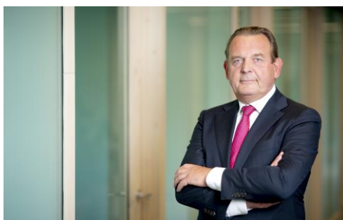
Nationale ombudsman Reinier van Zutphen

Curaçao en Sint Maarten hebben al een ombudsman, waarmee een goede samenwerking bestaat, zei Van Zutphen. In Aruba is weliswaar wetgeving aangenomen om ook een ombudsman aan te stellen, maar de benoeming daarvan laat op zich wachten. Hij opperde dan ook de mogelijkheid dat de Arubaanse bevolking door middel van een petitie bij de Staten aandringt op een snelle benoeming van een ombudsman. ‘Zet die volgende stap’.